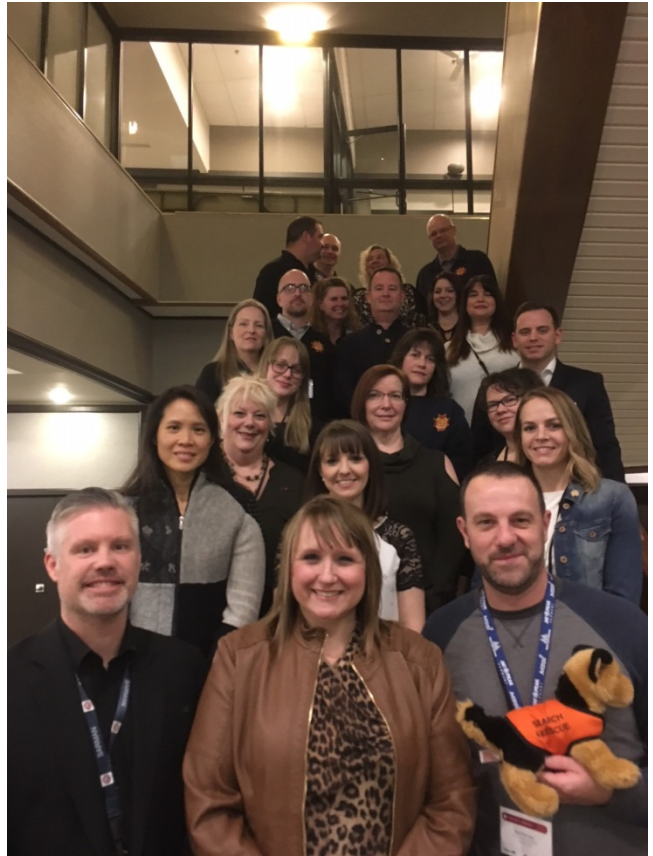
Membres du comité organisateur et du groupe de soutien

Au plaisir de vous voir au prochain SARscène!