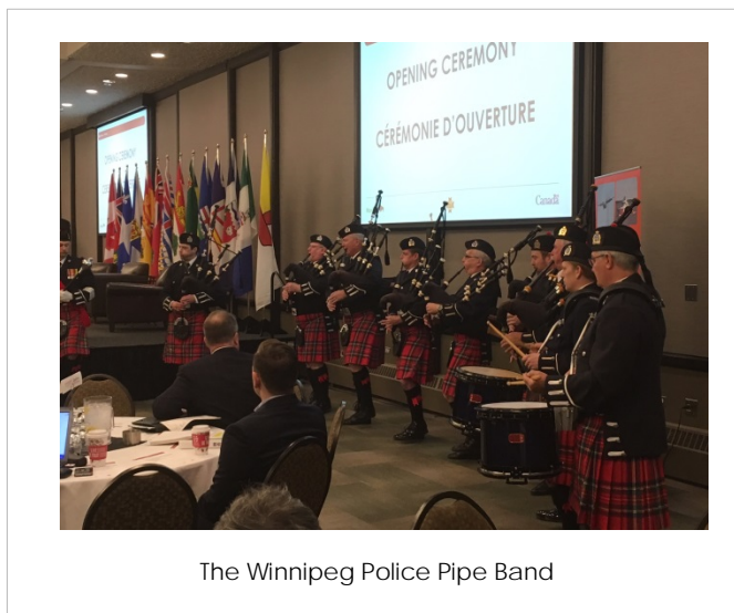
The Winnipeg Police Pipe Band

Bonjour à tous et bienvenue à SARscène 2017. Je tiens à remercier tout particulièrement les co-organisateur de la conférence, le Bureau du commissaire aux incendies du Manitoba et l'Association des bénévoles de R-S du Manitoba pour leur aide à mettre tout cela en place. Pour tous ceux d'entre vous qui ont voyagé pour être ici aujourd'hui, bienvenue à Winnipeg!